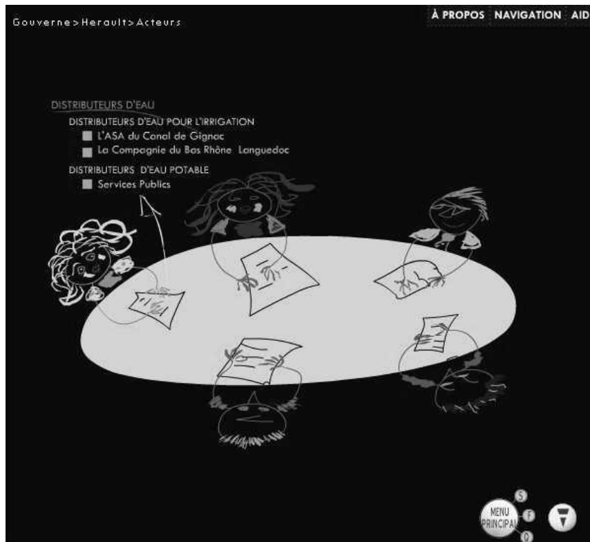
Figure 3. Module de présentation : présentation des acteurs sociaux.