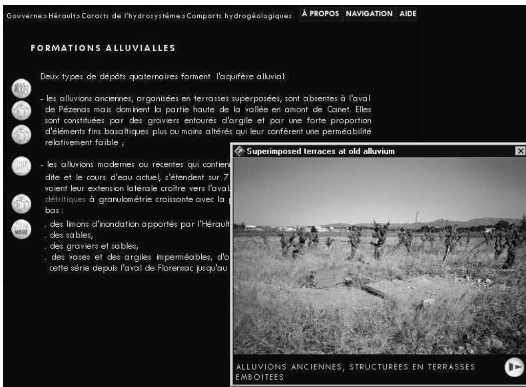
Figure 2. Module de présentation : exemple d'information sur l'hydrogéologie.

L'utilisateur navigue parmi les hypothèses d'évolution proposées dans les quatre thèmes (urbanisation, agriculture, aquifère karstique, climat) et les sélectionne pour composer les scénarios de gestion dont il désire visualiser et comparer les résultats (figures 4 et 5).