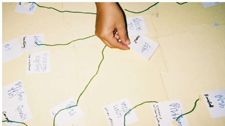
Figure 3. Les cartes sont reliées par des bouts de laine figurant les interactions.