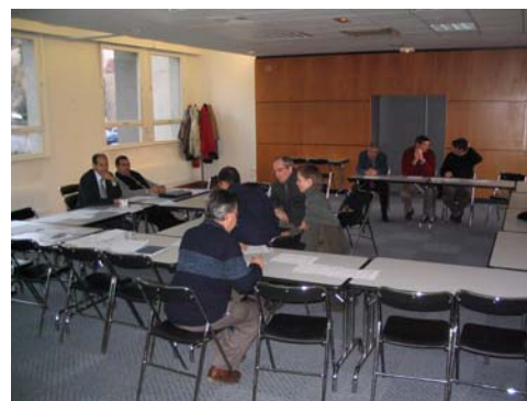
Figures 3 et 4. Journées de test et de discussion autour de l'exercice de simulation au Tadla et lors d'un séminaire en France.