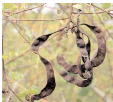
Fruits de Bauhinia

Bauhinia rufescens est un arbuste ou un arbrisseau buissonnant, très branchu, pouvant atteindre huit mètres de haut. Les rameaux sont disposés dans un même plan, les plus petits sont en forme d'épines. L'écorce est grise, lenticellée. Les feuilles sont petites, fortement bilobées, gris-vert mat, persistantes. Les fleurs sont jaune-verdâtre à blanc rose, de type cinq, groupées en racèmes de 5 cm. Les gousses sont indéhiscentes, contournées en spirale et presque noires à maturité ; elles contiennent de 4 à 10 graines brillantes.