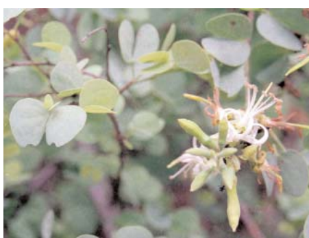
Feuilles et fruits

Bauhinia rufescens est un arbuste ou un arbrisseau buissonnant, très branchu, pouvant atteindre huit mètres de haut. Les rameaux sont disposés dans un même plan, les plus petits sont en forme d'épines. L'écorce est grise, lenticellée. Les feuilles sont petites, fortement bilobées, gris-vert mat, persistantes. Les fleurs sont jaune-verdâtre à blanc rose, de type cinq, groupées en racèmes de 5 cm. Les gousses sont indéhiscentes, contournées en spirale et presque noires à maturité ; elles contiennent de 4 à 10 graines brillantes.