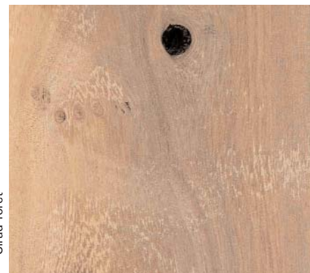
Bois de Bauhinia

Le bois est brun clair à grain fin. On l'utilise en charpente, sculpture, artisanat et comme bois de feu.