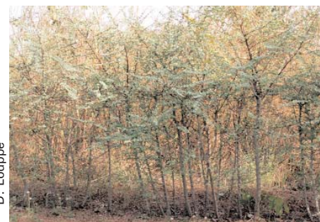
Haie de Bauhinia