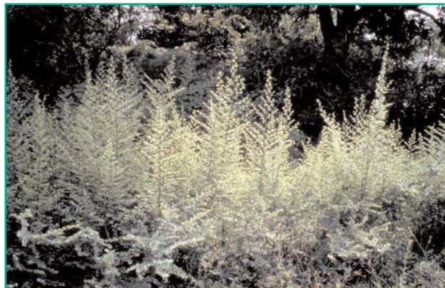
Jeune haie de Bauhinia

Famille : Fabaceae Sous-famille : Caesalpinioideae Nom scientifique : Bauhinia rufescens Lam.