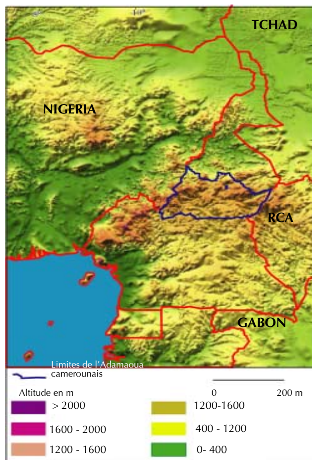
Figure 1. Situation de la région de l' Adamaoua camerounais.

(Podlewski, 1971 ; Boutrais, 1995). Les densités humaines y sont de l'ordre de 15 habitants au km 2 , largement inférieures à la moyenne nationale. L'étroite imbrication des paramètres géomorphologiques prédispose cette région à une dynamique accélérée dans un contexte bioclimatique un peu particulier à ces latitudes.