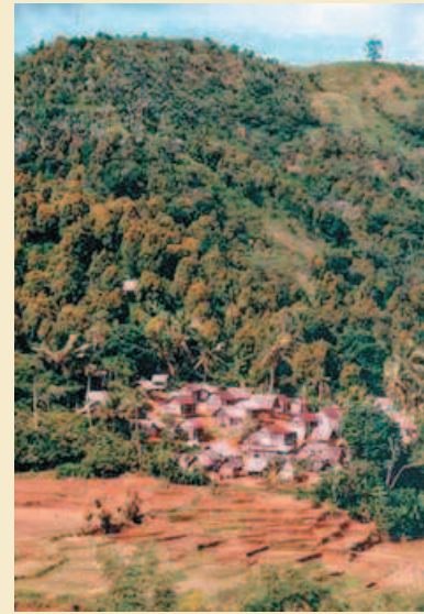
Paysage du nord-est de Madagascar, zone de présence de Prunus (riz, village, girofle, brûlis). Typical Prunus landscape in north-eastern Madagascar (rice fields, village, cloves, slash and burn).