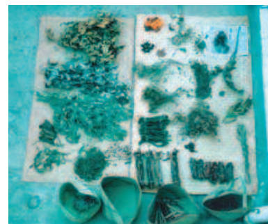
Plantes médicinales. Vente à Antananarivo, Madagascar. Medicinal plants on sale in Antananarivo.