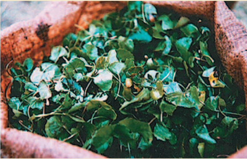
Centella fraîche. Fresh Centella.