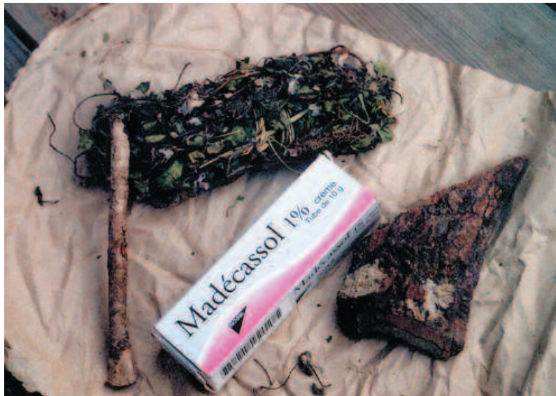
Les formes d'utilisation de Prunus et Centella : feuilles, écorces, spécialité pharmaceutique. Uses of Prunus and Centella : leaves, bark, pharmaceutical speciality.

cette convention a menacé d'en interdire toute exploitation commerciale. En réaction, le ministère des Eaux et Forêts a attribué à une société (la Sodip) le monopole légal d'exploitation de Prunus africana , au titre de mesure de protection de la ressource (BIODEV, 2000). En conséquence, cette entreprise apparaît comme l'exploitant principal de la ressource à Madagascar. Son usine transforme les écorces sèches de Prunus africana en extraits destinés à l'exportation pour le groupe pharmaceutique Inverni Della Beffa (Idb), qui les utilise dans la production d'un médicament traitant les troubles prostatiques.