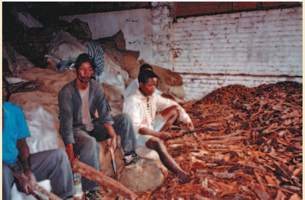
Unité de transformation du bois de Prunus . Processing Prunus wood.

À partir du cas des deux principales plantes médicinales exportées par Madagascar, Centella asiatica et Prunus africana , sont illustrées différentes modalités de partage juste et équitable, tel que préconisé par la Convention sur la diversité biologique, entre parties prenantes : laboratoire pharmaceutique étranger et entreprise malgache de bioprospection pour la première espèce, communauté locale et entreprise nationale exportatrice pour la seconde.