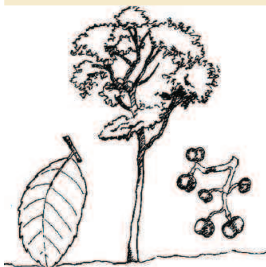
Planche botanique de Prunus . Botanical plate of Prunus .