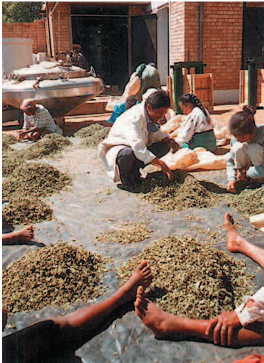
Tri manuel des feuilles de Centella à Madagascar. Manual sorting of Centella leaves in Madagascar.

Centella asiatica et Prunus africana sont les deux principales plantes médicinales exportées par Madagascar. Avec des caractéristiques très différentes en termes d'aires de répartition, de dynamique biologique et d'usages (tableau I),