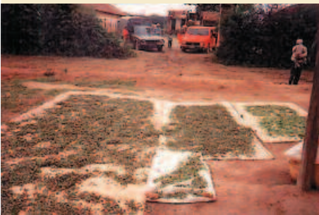
Centella séchée en entrepôts. Dried Centella in the Sotramex warehouse.

filière, le coût des mesures à entreprendre sera exorbitant et complètement dissuasif. Il est alors probable que l'exploitation de cette ressource cesse à Madagascar.