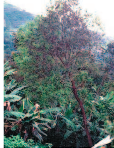
Prunus à Madagascar. Prunus in Madagascar .

une diversité de situations. Le fournisseur de ressources phylogénétiques est un acteur privé chargé de la collecte à l'échelle nationale (cas de Centella asiatica ) ou une collectivité locale (cas de Prunus africana ), en fonction des droits de propriété attribués sur la ressource. L'utilisateur est une firme internationale pharmaceutique ( Centella asiatica ) ou une firme nationale 2 . Dans le cas de Prunus africana , outre la question du partage des avantages qui est centrale dans notre analyse, se pose un problème de gestion durable de la ressource.