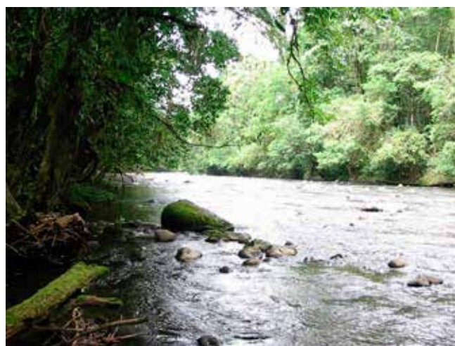
Les bassins versants forestiers régulent l'eau et protègent les sols afin de réduire les effets du climat

À Flores, en Indonésie, il s'avère que les bassins versants forestiers augmentent le débit de base (c'est-à-dire la part