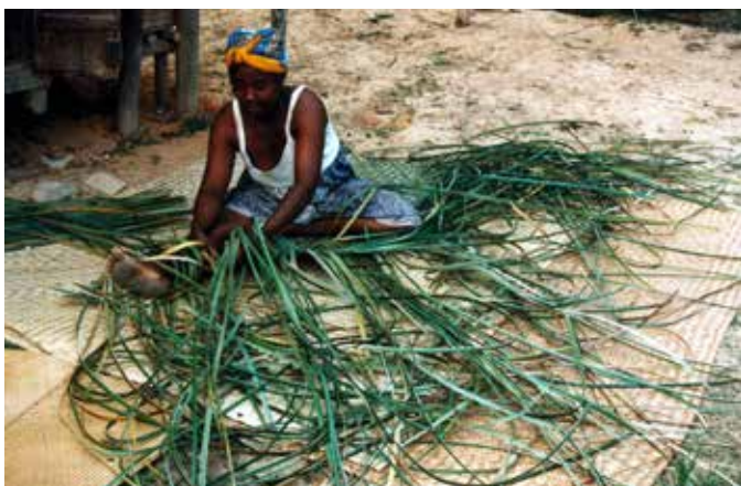
Les forêts et les arbres fournissent des biens aux communautés locales confrontées à des menaces climatiques

De nombreuses études indiquent que les ménages les plus pauvres dépendent davantage des produits forestiers dans leurs stratégies de réaction et d'adaptation. Par exemple, durant les inondations à Pacaya-Samiria, au Pérou, les jeunes et les ménages pauvres n'ayant pas accès aux terres en altitude ou à des stocks de poissons à proximité se sont mis à collecter des PFNL 15 . En période difficile, les ménages à faible revenu se tournent vers les forêts car les capitaux financiers, physiques et humains nécessaires aux récoltes, en particulier de PFNL, sont