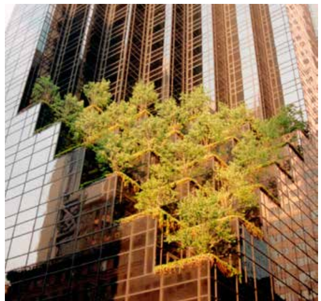
Les forêts et les arbres urbains régulent la température et l'eau pour des villes résilientes

La couverture végétale semble influencer fortement les températures de surface à Manchester. La température de